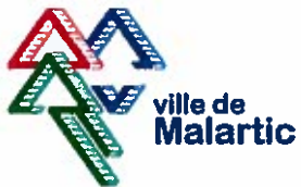
TABLEAU DES SOUMISSIONS 8 NOVEMBRE 2017 À 11 h 01 APPEL D'OFFRES 2017-11 DÉNEIGEMENT DES STATIONNEMENTS 2017-2018 / 2018-2019

- Hôtel de ville - Arena - Garage municipal