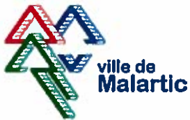
TABLEAU DES SOUMISSIONS 9 NOVEMBRE 2017 À 11 h 01 APPEL D'OFFRES 2017-10 DÉNEIGEMENT 2017-2018 / 2018-2019